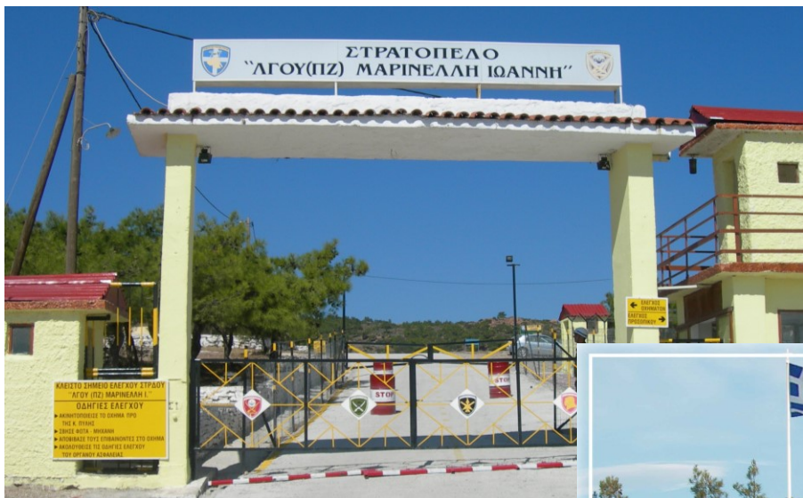
προτομή του στο Ηρώ του στρατοπέδου.